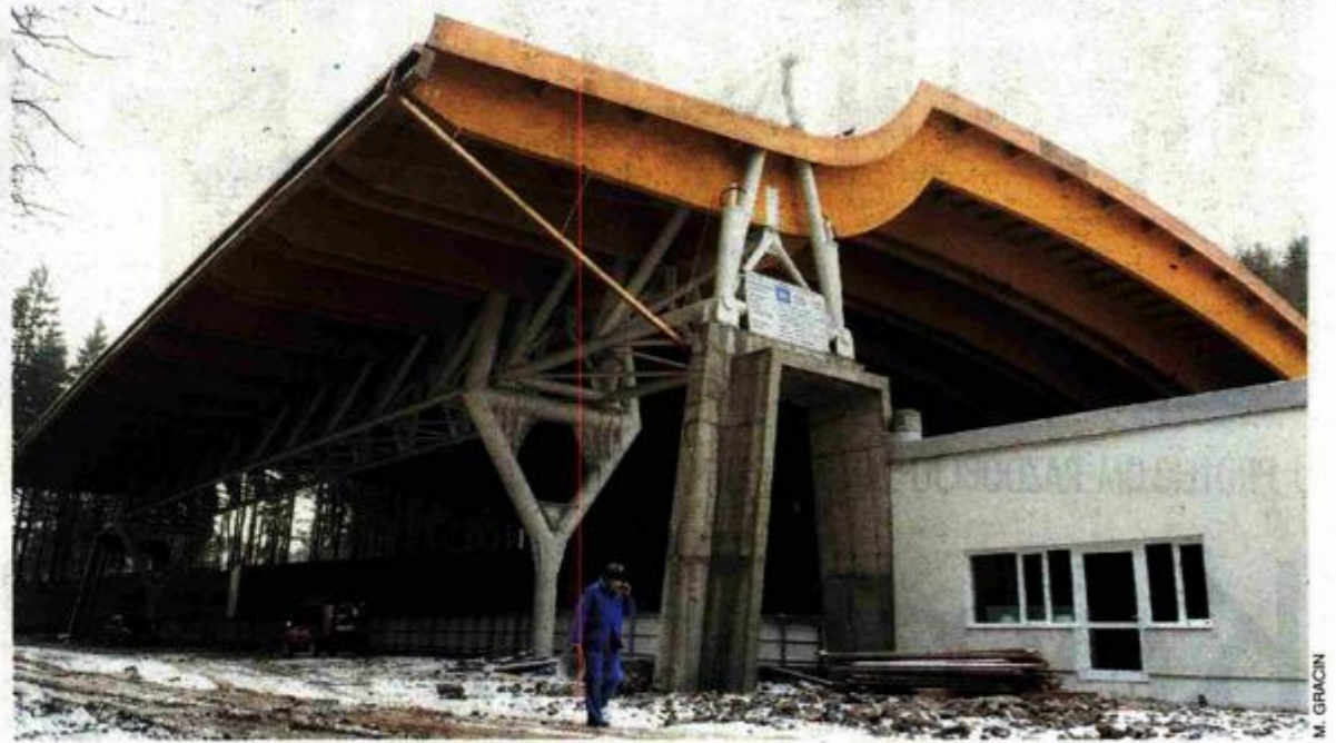
U izgradnji delničke multifunkcijske dvorane, odnosno klizališta, EU sudjeluje s 980 tisuća eura

EU sredstva znaju biti i teret. Prije kandidiranja gradovi ili općine trebali bi preispitati svoje stručne i organizacijske kapacitete te financijske mogućnosti jer jednom kada se sredstva dobiju nema više odustajanja – za one nespremne posljedice su vraćanje sredstava s kamatama, dolazak na »crnu listu« prijavitelja i loša reputacija