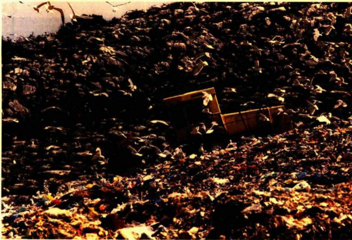
SMETLIŠTE BIKARAC pretvaranjem u suvremeni centar za gospodarenje otpadom učinit će ostala smetlišta u županiji nepotrebnima

trenutačno jedini te vrste u cijeloj Hrvatskoj, zatvorit će se sva ostala županijska smetlišta, za kojima više neće biti potrebe. Projekt se financira iz fonda ISPA, s točno 6.886.601 eurom, a uz njegovo odobravanje Komisija je istaknula da je to jedinstveni primjer kvalitetno pripremljenog i do